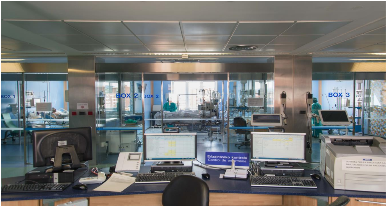
Kirurgia plastikoa, konpontzailea eta estetikoa ©