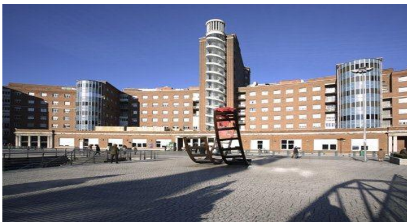
Angiologia eta Kirurgia Baskularra ©